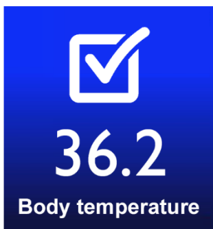
TEMPERATURA POR DEBAJO DEL LIMITE